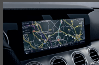
Navigatiepakket (61P) †