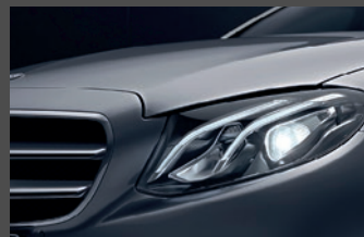
LED high performance koplampen