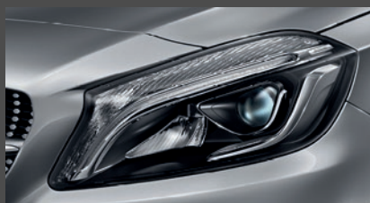
High-performance led-koplampen (632)