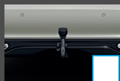
Trekhaak 2) (550) € 956