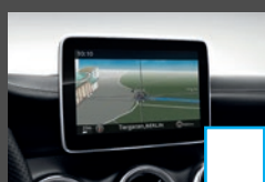
COMAND Online (531) € 2.118