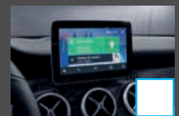
Smartphone integratie (14U) € 363