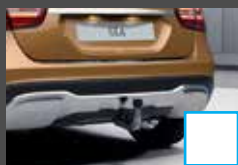
Trekhaak (550) € 956