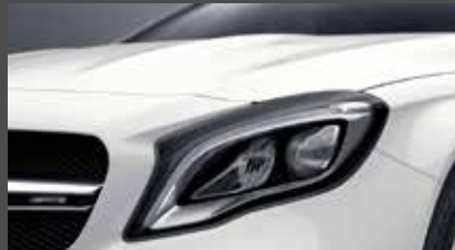
High-performance led-koplampen (632)