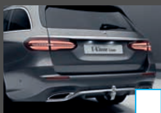
Trekhaak € 1.162