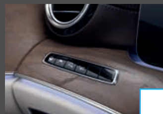
Rijassistentiepakket Plus (P20) € 2.904