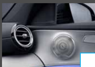
Burmester Surround Sound (810) € 1.029