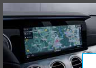
COMAND Online (531) € 1.271