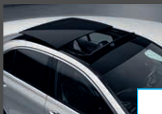
Panoramaschuifdak (413) € 2.142