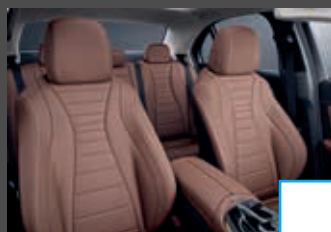
Nappalederen bekleding (8XX) (i.c.m. Business Solution AMG) € 2.662