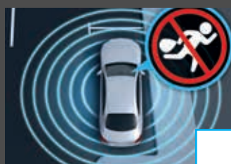
Antidiefstalpakket (P54) € 532