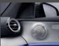
Burmester® surround sound system (810)

Inclusief lederen bekleding (2XX) en nappalederen bekleding (8XX) i.c.m. Business Solution AMG