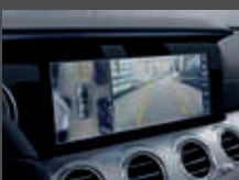
Parkeerpakket met 360°-camera (P47)