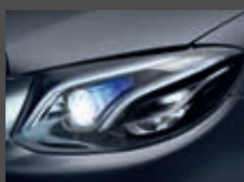
Multibeam LED (P35)